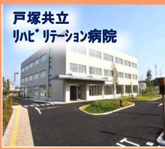
戸塚共立 リハビリテーション病院