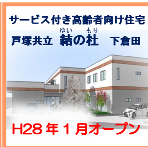
サービス付き高齢者向け住宅 戸塚共立 結の杜 下倉田