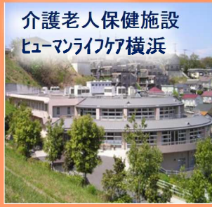
介護老人保健施設 ヒューマンライフケア横浜