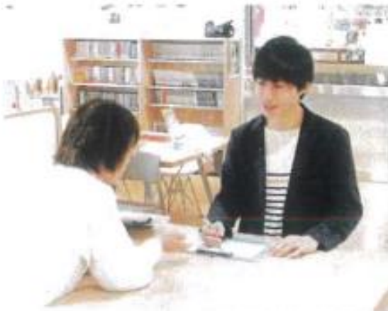
津田沼献血ルーム(千葉県)

受付確認票への記入と、本人確認を行います。その後、質問事項に回答していただきます。プライバシーは厳守されるのでご安心ください。